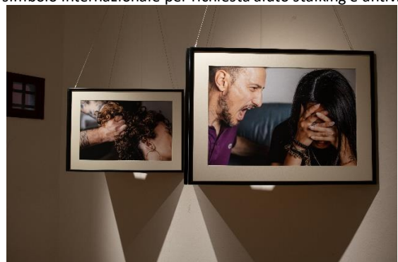
Dittici sulla violenza verbale e violenza domestica (VISIONE OTTUSA)