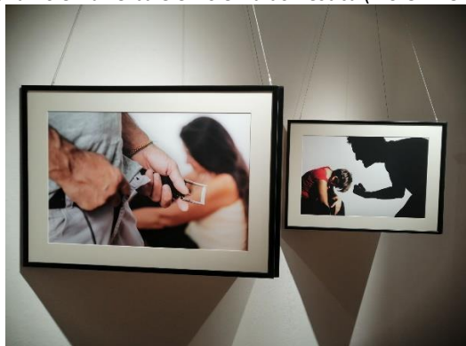
Dittici sulla violenza sessuale e violenza fisica (VISIONE OTTUSA)